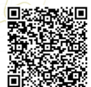
NUMÉRISER POUR VISUALISER LA CARTE INTERACTIVE